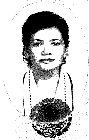
SISTEMA EDUCATIVO NACIONAL BAJA CALIFORNIA SUR